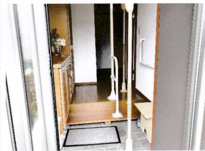
自宅の実際の環境でリハビリを 行うため、生活に直結します