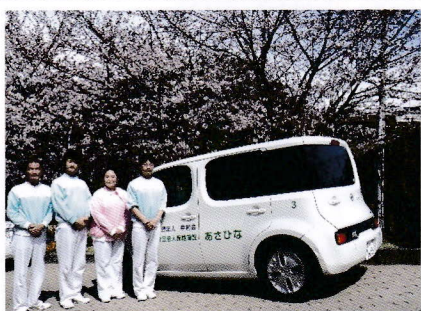
我々が皆様のご自宅に伺います (女性職員も在籍しています)